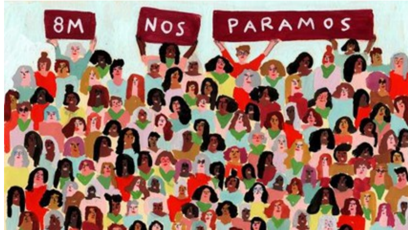
ILUSTRACIÓN: MARÍA LUQUE